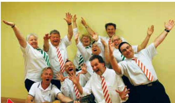
La Troupe Improglio

Le théâtre alsacien sera à l'honneur au mois de mars. La Troupe ImproGlio de Soultz-sous-Forêts proposera un spectacle d'improvisation le samedi 17 mars 2018 à partir de 20h15 sur la scène du Cercle. Les réservations pour cette manifestation seront ouvertes prochainement. La formule de ces représentations rend chaque spectacle unique. Les prestations sont interactives, le public est sollicité pour donner un thème, puis les comédiens, après une courte réflexion, improvisent des sketches. Différentes formes, avec un nombre variable de comédiens, sont proposées, des abécédaires, des scènes mimées, des contes revisités. Les sketches sont courts, et parfois soutenus par de la musique également improvisée. Une buvette avec petite restauration sera à votre disposition pour cette soirée récréative.