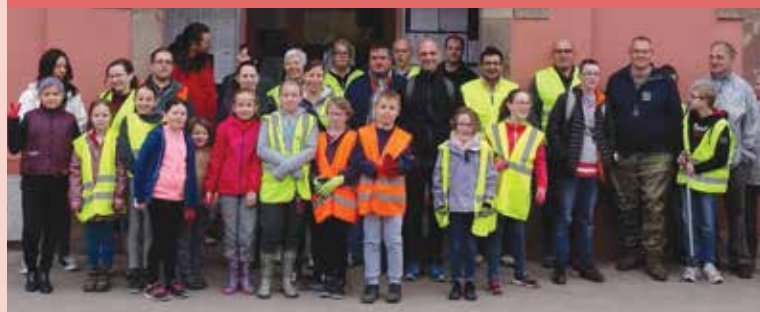
OSCHTERPUTZ : Comme chaque année, le traditionnel nettoyage de printemps a été effectué au départ de la mairie, les membres du conseil municipal des enfants étaient de la partie. (01/04)