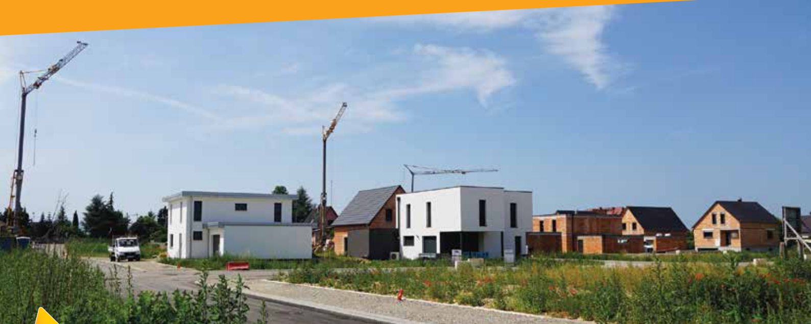
Le revêtement définitif de la voirie de l'AFUA sera réalisé en 2018, tout comme l'éclairage et les plantations.