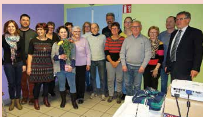
MAISONS FLEURIES : La cérémonie a permis de féliciter et de remercier les lauréats du concours. (03/03)