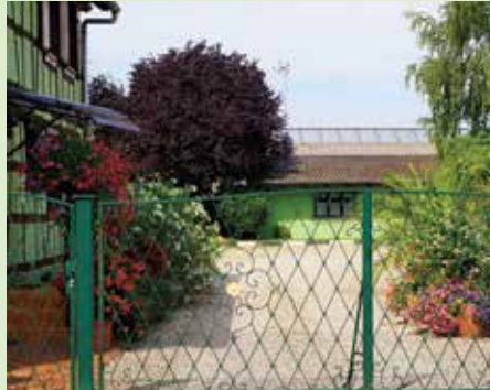
4 e prix : M. Alain SCHNELL