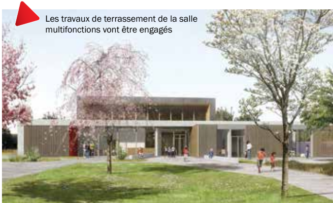
Les travaux de terrassement de la salle multifonctions vont être engagés

Au courant du mois de décembre dernier, la Communauté de Communes du Canton d'Erstein a émis l'ordre de service pour le démarrage des travaux de terrassements sur le terrain qui va accueillir la future salle multifonctions de Sand. C'est elle en effet qui assurera, en lien étroit avec la commune et pour le compte des deux collectivités, la maîtrise d'ouvrage de ce grand chantier. Les travaux démarreront dès que la météo le permettra et devront nous mener vers une réception du bâtiment au printemps 2019.